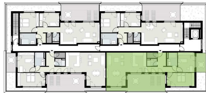
Übersichtsplan - Staffelgeschoss